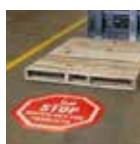
Segnaletica a terra