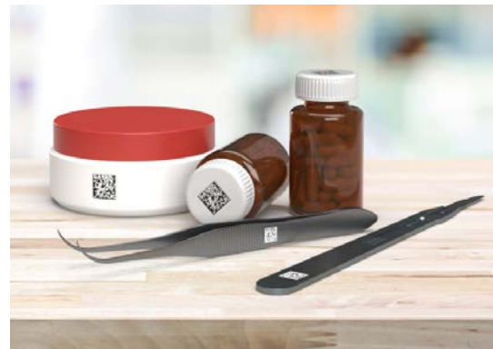
Codici DPM (Direct Part Mark) stampati direttamente sui prodotti.