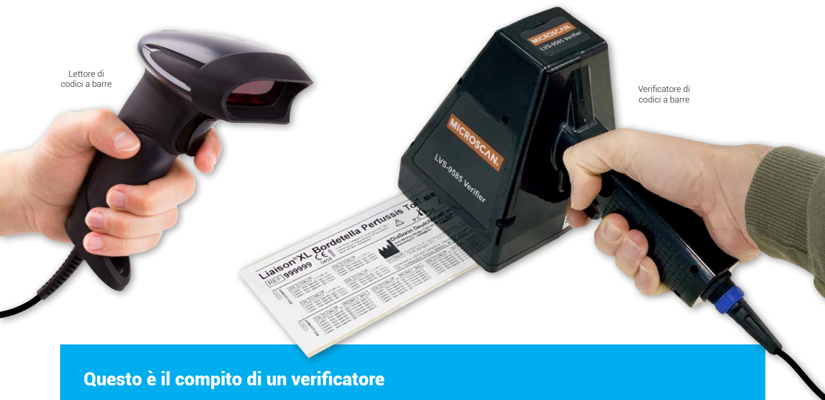
Letto re di codici a barre

Perciò è fondamentale fare una netta distinzione fra l'unico valore fornibile dal lettore (la sequenza dei caratteri contenuti nel codice) e quelli che solo un verificatore è in grado di fornire. Gli algoritmi che governano la decodifica seguono infatti criteri diversi a seconda delle diverse tipologie di lettore e della casa costruttrice e possono tentare di decodificare lo stesso simbolo ottenendo risultati completamente diversi. Basta che un solo attore della supply chain non sia in grado di leggere il codice per bloccare l'intera filiera.